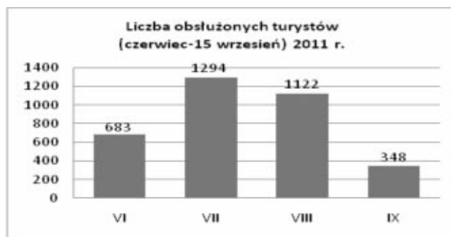
Wykres Nr 1 : Liczba turystów w sezonie letnim (od czerwca do 15 września 2011r.)

RCIT jest miejscem dystrybucji „Miesiąca w Koszalinie”, bezpłatnego informatora społeczno-kulturalnego, „Gazety Ziemskiej” oraz miesięcznika „Prezisz”.