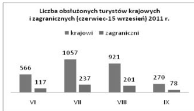
Wykres Nr 2 : Liczba turystów krajowych i zagranicznych (od czerwca do 15 września 2011r.)

wództwa zachodniopomorskiego oraz Pojezierza Drawskiego. Poszukiwane są także mapy obejmujące swym zasięgiem całe Wybrzeże Bałtyku.