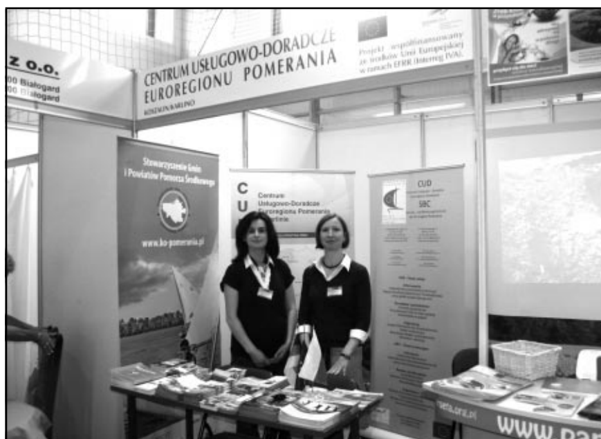
Na Targach Gospodarczych w Białogardzie

W dniach 17-18.09.2011 r. Centrum Koszalin/Karolino prezentowało swoją działalność podczas XI Regionalnych Targów Gospodarczych w Białogardzie, integrując się tym samym z przedsiębiorcami z regionu koszalińskiego. Zorganizowane przez Sto-