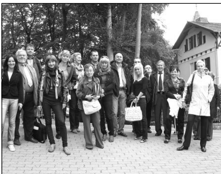
Jesteśmy w Inselklinikum Heringsdorf

W razie dużego zainteresowania, planuje się zorganizowanie wyjazdu grupowego. Wszystkich zainteresowanych zapraszamy do naszego biura przy ul. Zwycięstwa 42 w Koszalinie, tel. 94 342-65-50, cud@ko-pomerania.pl